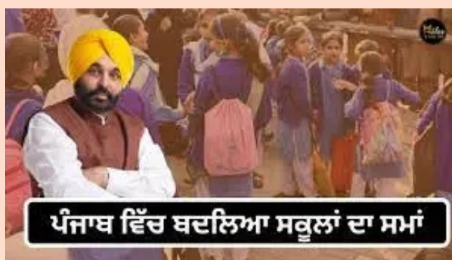
ਪੰਜਾਬ ਵਿੱਚ ਬਦਲਿਆ ਸਕੂਲਾਂ ਦਾ ਸਮਾਂ

ਚੰਡੀਗੜ੍ਹ, 31 ਦਸੰਬਰ, ਸੂਬੇ ਵਿੱਚ ਵੱਧ ਰਹੀ ਠੰਡ ਅਤੇ ਉਂਦ ਦੇ ਮੌਦੇਨਜ਼ਰ ਪੰਜਾਬ ਸਰਕਾਰ ਨੇ ਸਾਰੇ ਸਰਕਾਰੀ, ਪ੍ਰਾਈਵੇਟ ਅਤੇ ਸਹਾਇਤਾ ਪ੍ਰਾਪਤ ਸਕੂਲਾਂ ਦਾ ਸਮਾਂ ਬਦਲ ਦਿੱਤਾ ਹੈ।