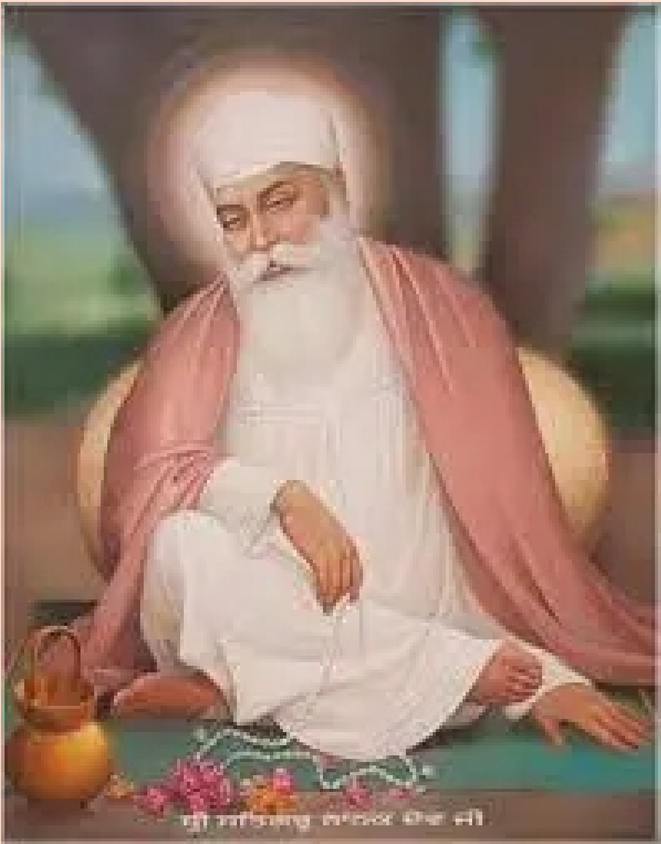
“ਪਰਹਰਿ ਪਾਪੁ ਪਛਾਣੈ ਆਪ॥” (ਸਤਿਗੁਰੂ ਨਾਨਕ ਦੇਵ ਜੀ) ਗੁਰੂ ਨਾਨਕ ਬਾਣੀ ਵਿੱਚ ਲਿਖੇ ਪਾਪ ਕਰਮਾਂ ਦੀ ਸੂਚੀ:-

ਸਤਿਗੁਰੂ ਨਾਨਕ ਦੇਵ ਜੀ ਤੋਂ ਸਿੱਖ ਪੰਥ ਆਰੰਭ ਹੁੰਦਾ ਹੈ। ਗੁਰੂ ਜੀ ਦੀ ਰਸਨਾ ਤੋਂ ਉਚਾਰੀ ਹੋਈ ਬਾਣੀ ਨੂੰ “ਗੁਰਬਾਣੀ” ਕਿਹਾ ਗਿਆ ਹੈ। ਗੁਰਬਾਣੀ ਸਿੱਖ ਪੰਥ ਦਾ ਸੰਵਿਧਾਨ ਹੈ। ਗੁਰਬਾਣੀ ਵਿੱਚ ਜਿਨ੍ਹਾਂ ਕੁਕਰਮਾਂ ਦੀ ਮਨਾਹੀ ਹੈ, ਉਹ ਕੁਕਰਮ “ਪਾਪ” ਹਨ। ਸਤਿਗੁਰੂ ਨਾਨਕ ਦੇਵ ਜੀ ਨੇ ਆਪਣੀ ਰਸਨਾ ਤੋਂ ਉਚਾਰੀ ਬਾਣੀ ਵਿੱਚ ਜਿਨ੍ਹਾਂ ਪਾਪ ਕਰਮਾਂ ਦੀ ਮਨਾਹੀ ਕੀਤੀ ਹੈ, ਉਹ ਗੁਰੂ ਗ੍ਰੰਥ ਸਾਹਿਬ ਜੀ ਵਿੱਚ ਅੰਕਿਤ ਹਨ। ਹਰ “ਗੁਰੂ ਨਾਨਕ ਨਾਮ ਲੇਵਾ ਸਿੱਖ” ਨੂੰ ਉਹਨਾਂ ਪਾਪ ਕਰਮਾਂ ਤੋਂ ਬਚਣ ਦੀ ਲੋੜ ਹੈ।